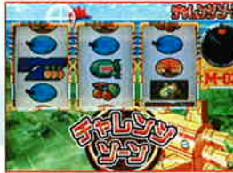
1200Pハマリで天井CZに突入する。ナビ回数等の詳細は不明だ。

「BIG中のチェリー入賞」で、BIG中はチェリーが入賞する度にナビ回数が上乘せられていく仕組み。チェリー1回の入賞につき内部にナビが何個貯まるかは現時点では不明だが、ナビ回数とヒキ次第でCZとRT、そしてBIGを絡めた一撃大量獲得も十分可能。マリンバの名は単なる飾りではなく、爆発力に關してもしっかりと受け継がれているのである。